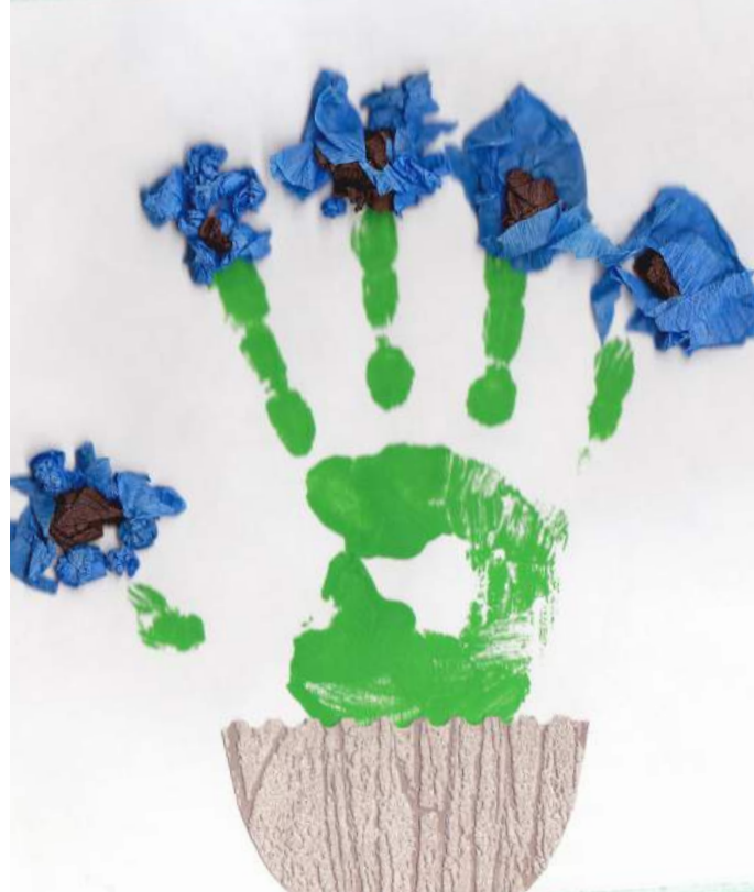
Evelīna Vorobjeva (Baltinavas vidusskolas pirmsskolas izglītības grupa). Pavasara vēstneši.