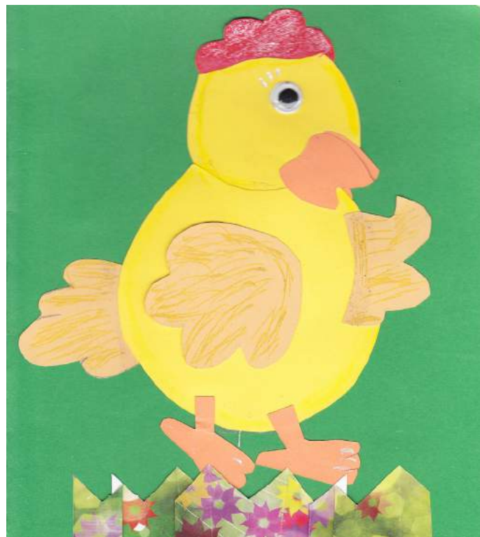
Amija Gibala (Baltinavas vidusskolas pirmsskolas izglītības grupa). Ceļā uz Lieldienām.

Laikraksta „Izglītība un Kultūra” elektroniskais pielikums „Pirmsskolas Izglītība”